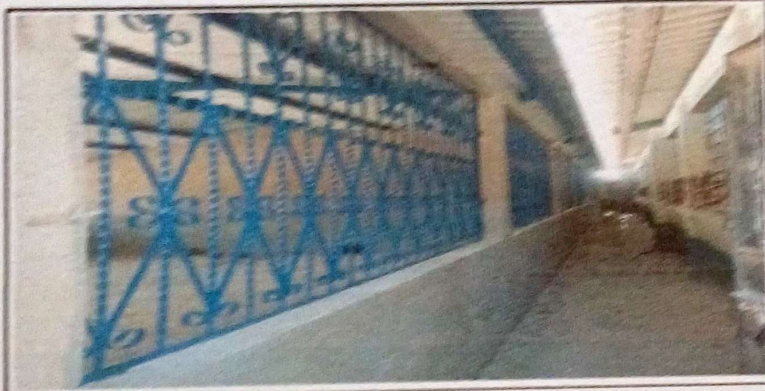
Foto 3: Evidencia el 60% del trabajo avanzado a beneficio de la Comunidad Educativa.