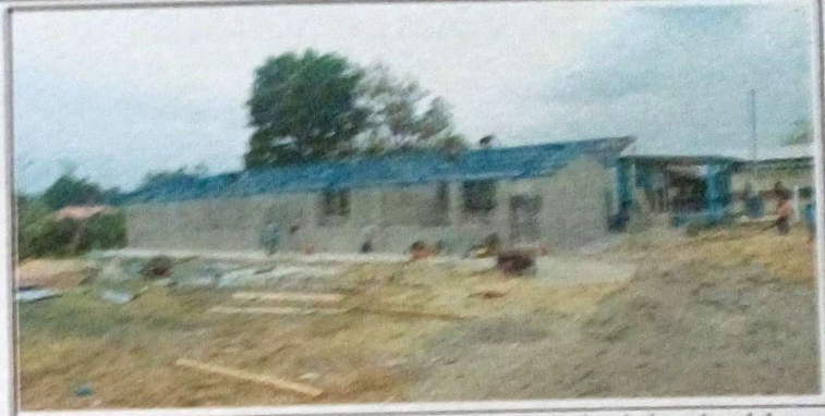
Foto 2: En este proceso se realizó el cambio de techo de la aulas del Centro Educativo.