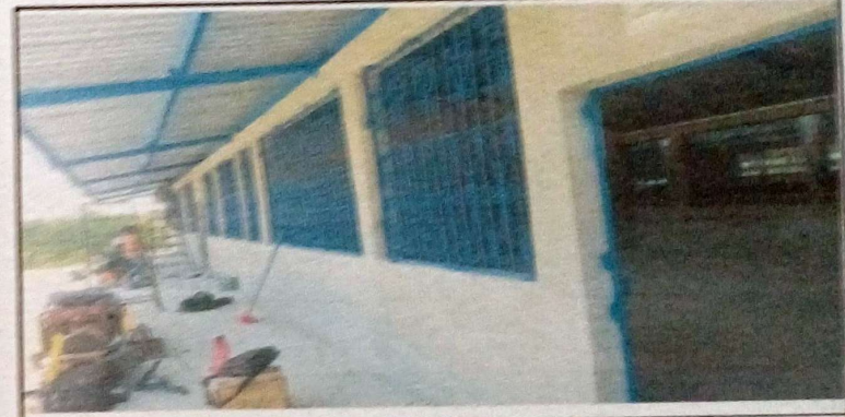
Foto 4: En esta fotografía da a conocer el avance del remozamiento realizado en el predio de la escuela.