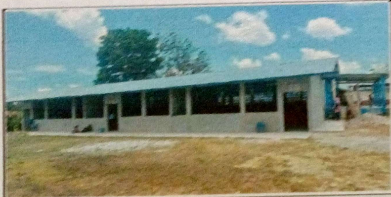
Foto 5: Es una de las evidencias sobre el proyecto ejecutado en el Establecimiento Educativo.